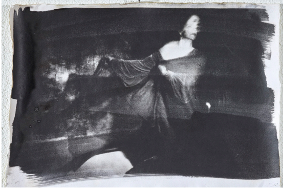
Fotoemulsion auf Büttenpapier auf Eisenrahmen montiert, 41x60 cm